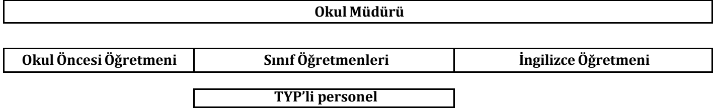
Şekil 1. Tavas Kozlar İlkokulu Teşkilat Şeması